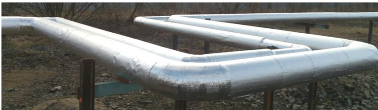
ANTICOR Bohemia s.r.o. vlastní ISO 9001.

Společnost ANTICOR Bohemia s.r.o. nenese odpovědnost za ztráty a škody vzniklé přímo nebo nepřímo nesprávným používáním těchto výrobků.